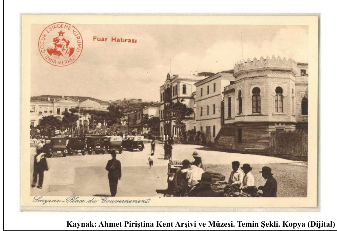
Kaynak: Ahmet Piriştina Kent Arşivi ve Müzesi. Temin Şekli. Kopya (Dijital)